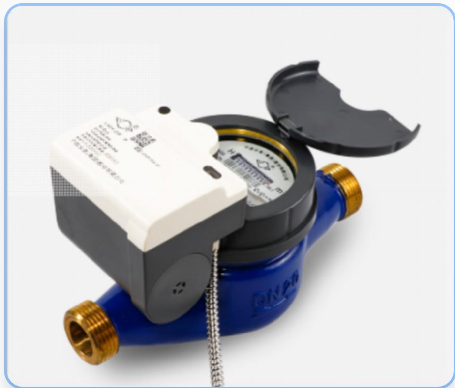
智能水表产品实拍 · 精准计量 品质保障