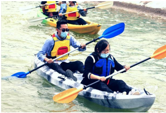
图 10：企业团建活动图

强民主管理，关爱弱势群体，提升员工幸福指数。公司建立了差异化员工支持体系，与员工及时签订劳动合同、为员工足额交纳五险一金，同时为员工提供了生日礼品，蛋糕卡，免费工作餐，住宿，提供人才公寓和集体宿舍；公司提供员晋升通道、岗位补贴、绩效考核、奖励机制，促进员工成长。为丰富公司员工的业余生活，公司工会定期或不定期组织员工活动，迎新长跑、迎新春拔河比赛、妇女节旅游、男子篮球赛、趣味运动会、青年职工读书分享、秋游团建、迎国庆书画摄影作品展等，着力打造和谐向上的企业文化氛围，增强团队的凝聚力及员工归属感。