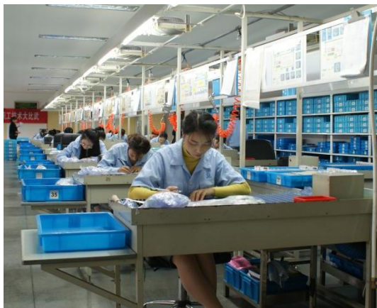
图 8：公司技能比武大赛

公司制定人才培养、人才薪酬管理等相关规章制度，为技能人才的培养提供有力保障；立足生产需求和职工实际情况，全面完善公司培训机制；打造形式多样的技能学习交流平台，开展“创意工夫”系列活动、职工“技术大比武”活动，激发员工探索思维，挖掘降本增效的创意提案；以“师带徒”培养模式为基点，紧密围绕技能攻关、创新创效、安全生产及职业道德等方面开展工作，让技能人才在实践中得到专业技能提升与突破。