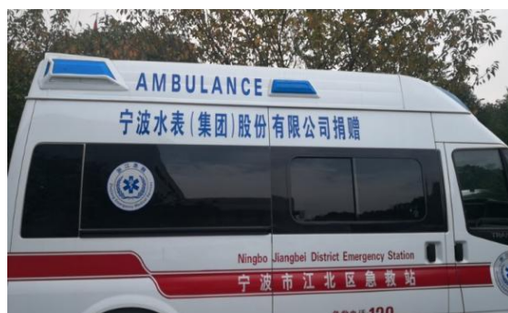
图 20：公司捐赠救护车

防控措施，持续完善企业疫情布控。相关措施包括：开展疫情防控宣传，加强人员日常防护配套，每日早晚对生产办公区域进行全面消毒，严格每日健康信息上报等。公司一手抓防疫一手抓复工复产的做法得到政府领导充分肯定，成为宁波市第一批复工复产的企业，将疫情对企业的影响降至最低，保障企业平稳向上发展。