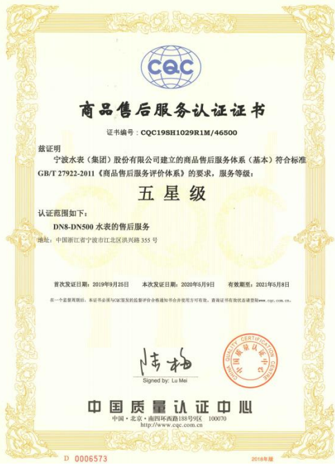
图 6：商品售后服务认证证书