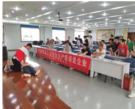
图 16：员工生产安全培训